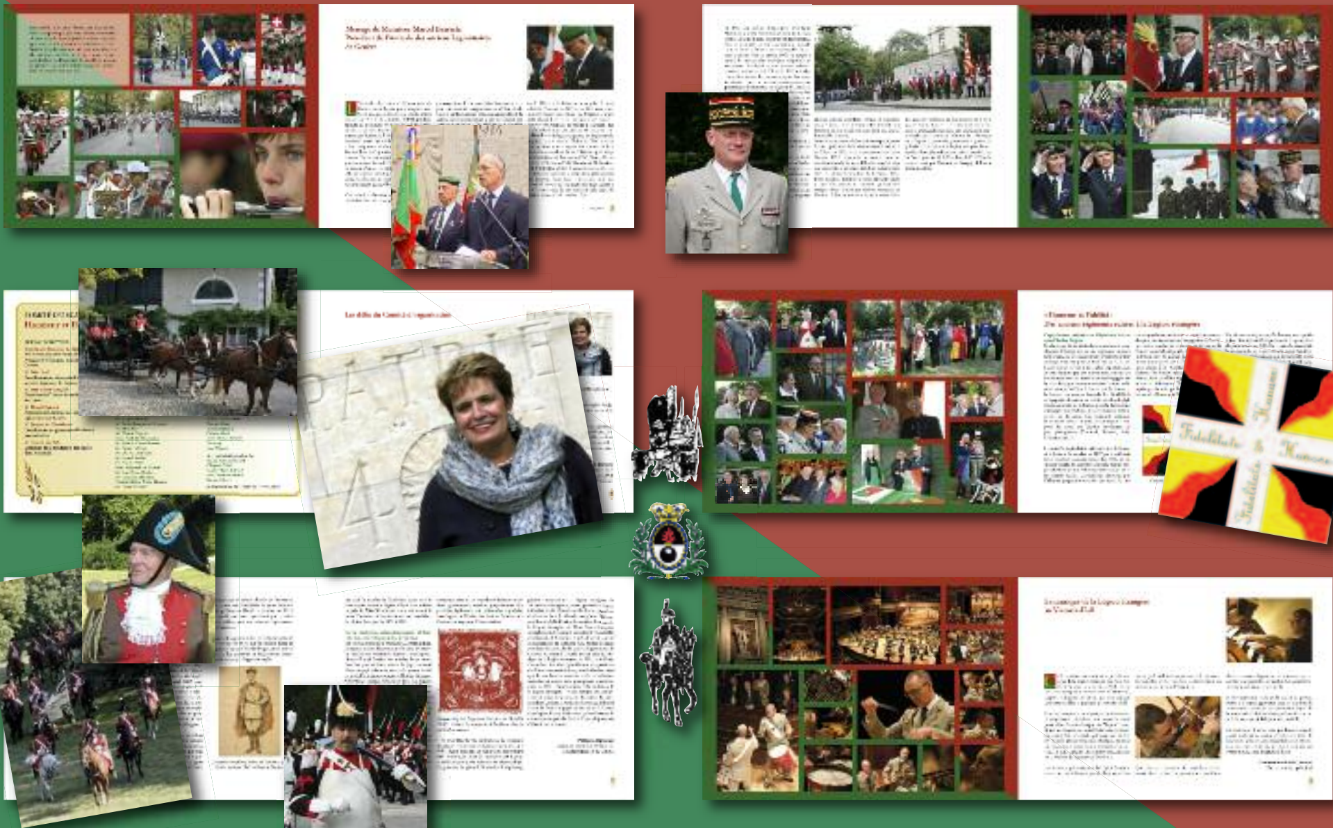
Ouvrage commémoratif des manifestations des 26 et 27 septembre 2008, à Genève et au Château de Penthes, à l'occasion du 90 e anniversaire de la création de l'Association des volontaires suisses (devenue l'Amicale des anciens de la Légion étrangère de Genève) placées sous le haut patronage de la Confédération suisse, des Conseils d'Etat de la République et canton de Genève et du canton de Fribourg, de l'Ambassade de France à Berne et des consulats généraux de France à Genève et à Zurich et organisées sous l'égide de l'Union des sociétés françaises de Genève.